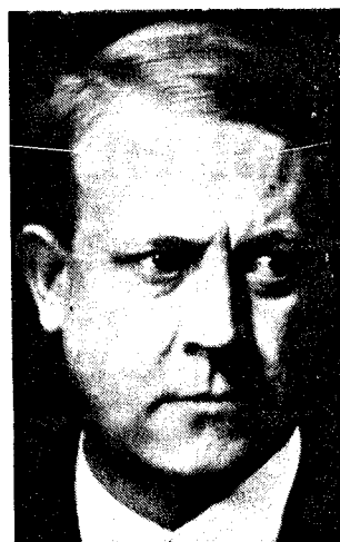
Øystein Sørensen forteller i sin bok om hvorfor mange av dem havnet hos Quisling – .