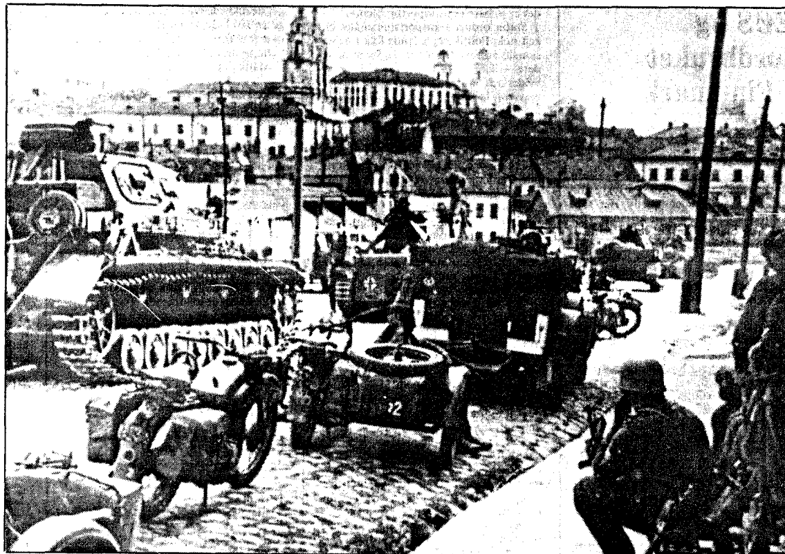
KAMPER: Allerede etter en ukes kamper ble Minsk, hovedstaden i Hvite-Russland, erobret av tyske panserstyrker på midtavsnittet. Her tar erobrerne en pause i byens sentrum.