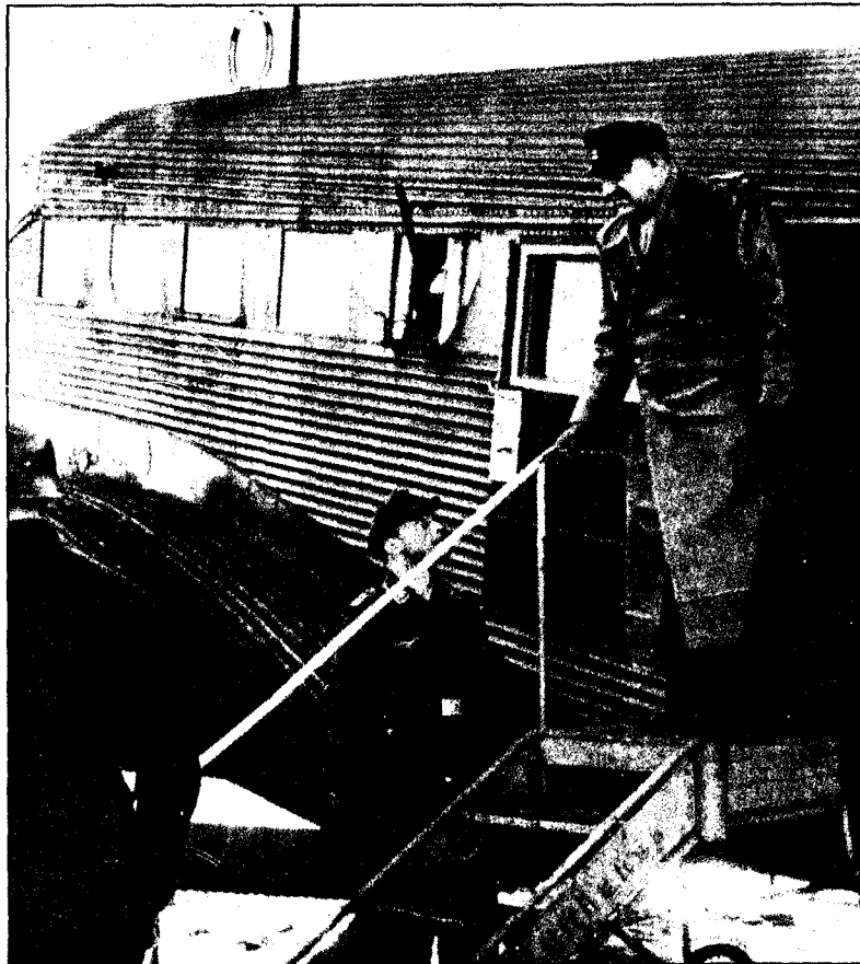
Til det avgjørende møtet med Hitler i 1939 tok Quisling toget. Seinere, som her under krigen, foregikk hans besøk med Der Führer med Lufthansas faste flugt Oslo-Berlin.