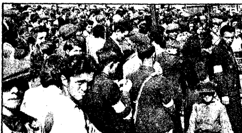
TRIKKEKØ: Trikkene går fortsatt i ghettoen, og folk stivler sammen på holdeplassen.

LIKEGYLDIGHET: En utsultet tigger med verkende sår på bena kan bare konstatere likegyldigheten hos dem som haster forbi. Også de er fanger i ghettoen, og vet at hans skjebne snart vil innhente også dem.