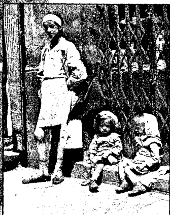
TIDLIG ELDET: Selv de minste småpikene i Warszawa-ghettoen fikk stadig mer alderdommelige ansikter, etter hvert som sulten utmagret dem. Det hjalp lite at mødrene forsøkte å pynte dem med hårslyffer og skaut.