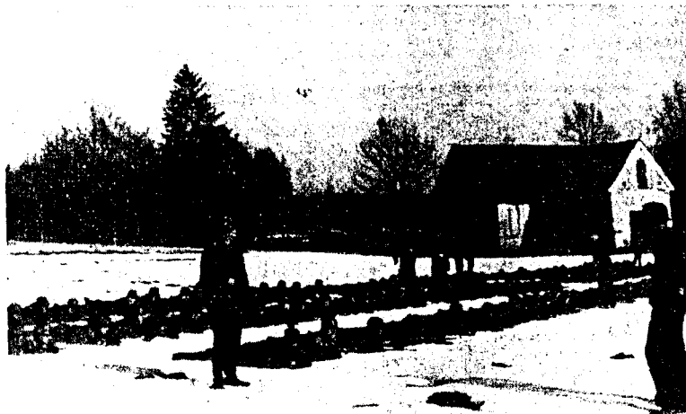
Graz - Schießstand

Das Volk war wie gelähmt, die Verteidigung ebenso. Zentrale Kommandobehörden waren plötzlich nicht mehr da. Vorbefehle für eine solche Lage fehlten gänzlich. In den nächsten Tagen und Wochen legten ganze Heeresverbände die Waffen nieder. Durch englische, französische und exilpolnische Truppen unterstützt, leisteten norwegische Verbände bei Narvik am längsten Widerstand, jedoch als die Kämpfe um Narvik nach zwei Monaten durch den Rückzug der alliierten Verbände beendet waren (man fand es nicht einmal nötig, das norwegische Oberkommando zu benach-