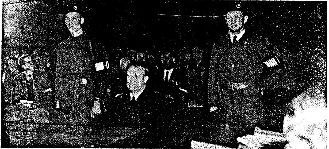
Saken mot Quisling, 1945. Retten trodde han var drevet av maktbegjær. Arkivet viser noe annet.