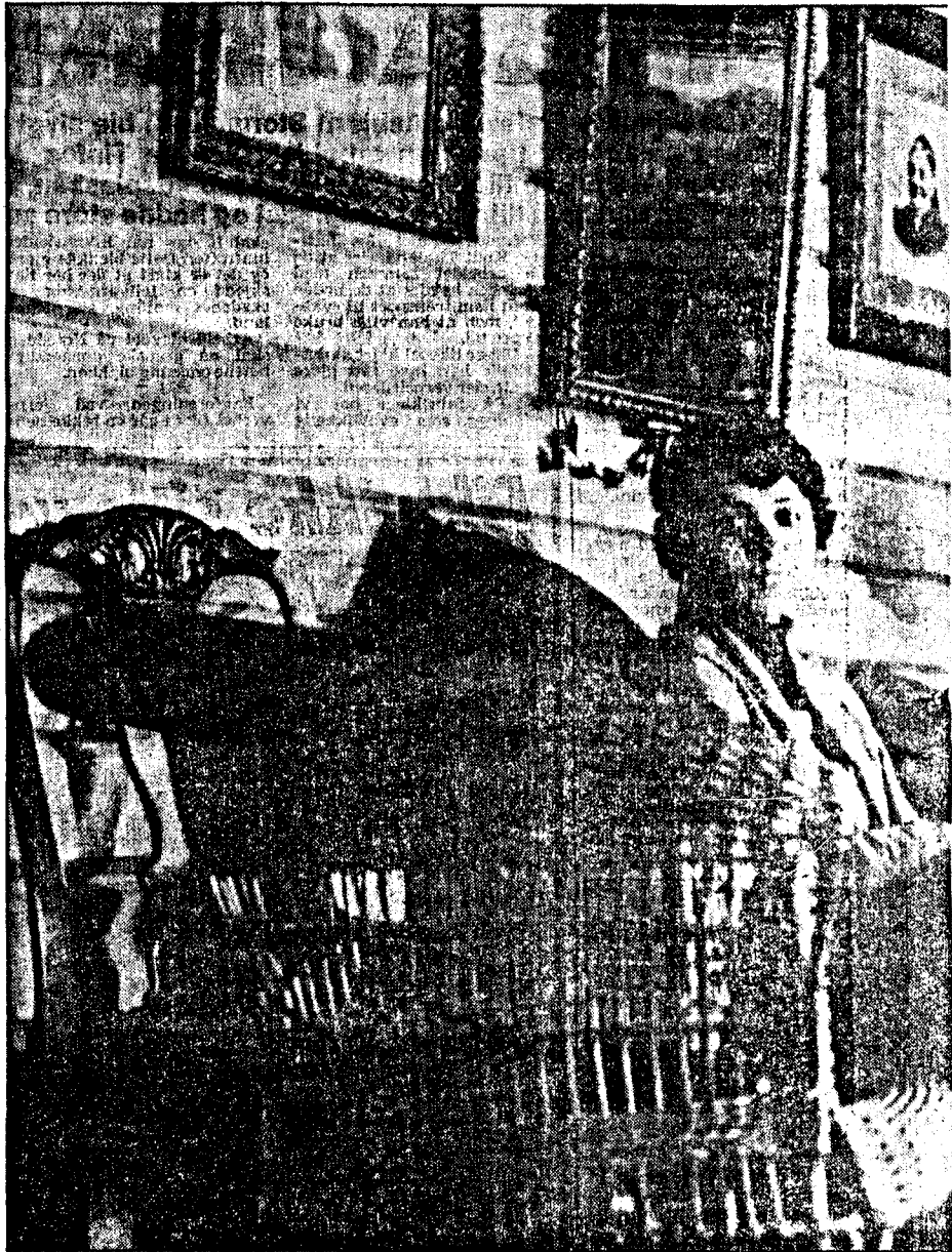
Vidkun Quisling og Maria, fotografert på Jonsbryg etter at de kom hjem fra Russland i 1929.

Han trakk også den nærliggende slutning at «det er å frykte, at mange av de bildene du fremdeles har hjemme, ikke