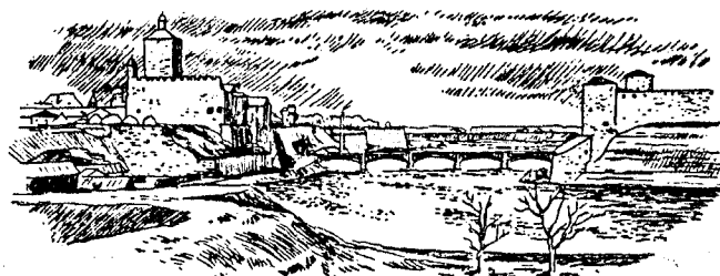
Die Hermannsfestung an der Narwa (links). Gegenüber die Festung Iwangoorod