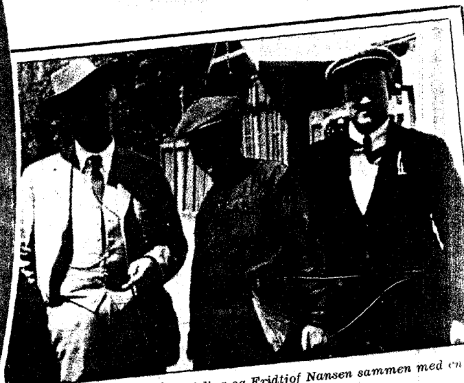
INTERNASJONALIST: Quisling og Fridtjof Nansen sammen med en svensk representant sommeren 1925.