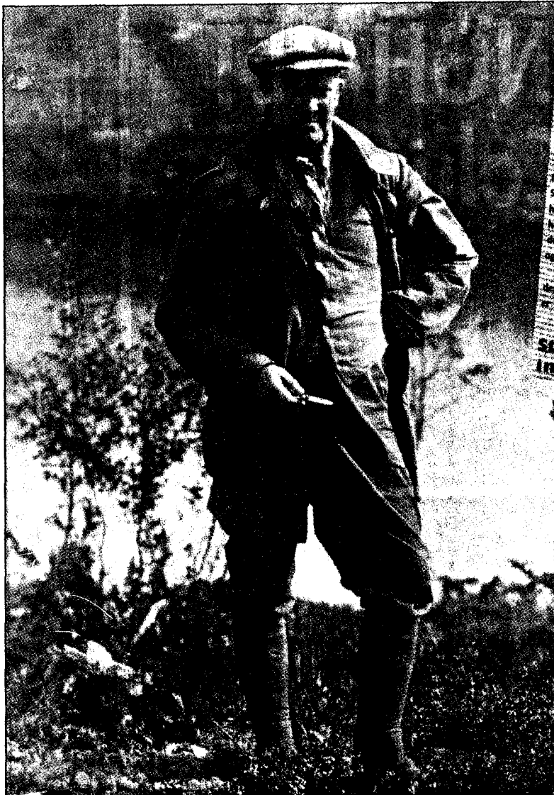
Samlet framstår et spennende – og skremmende bilde – av Vidkun Quisling som politisk avvikler. Her er han avbildet som fjellvandreri i Fyresdalsteiene ca. 1930, fotografert av sin bror.