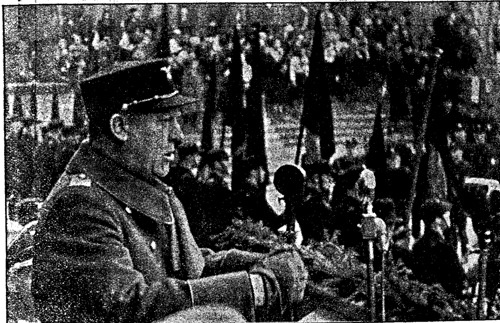
FØREREN: Vidkun Quisling taler til over 3000 hirdmenn fra hele Norge 2. november 1941.