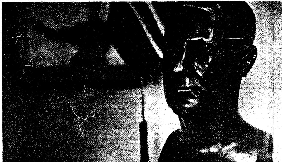
FØREREN: Quislings portretter kikker ned fra veggene i møterommet på «Institutt for Norsk Okkupasjonshistorie», og på en reol står Quislings byste. Instituttet er et møtested for gamle NS-folk og Quisling er fortsatt føreren.

— Jeg har lest første del og er glad den er kommet. Den er et steg på veien mot et riktigere bilde av mannen. Det meste i boken er ukjent for de fleste. Den dokumenter at Quisling ikke var noen nikkedukke.