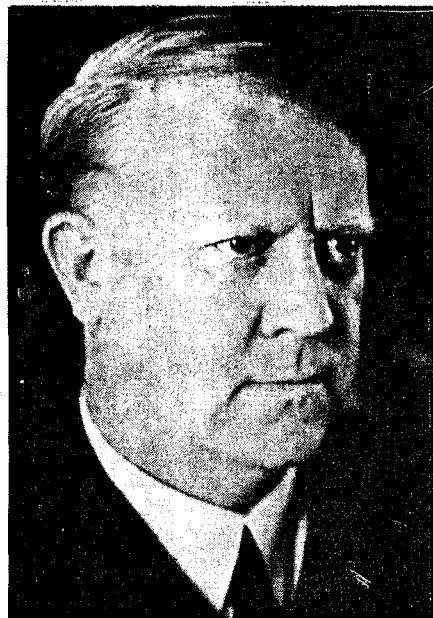
FOR- RÆDERI: Om kvelden 9. april 1940 sto Vidkun Quisling frem i Norsk Rikskring- kasting og proklamerte den nye NS- regjeringen. Samtidig tilbakekalte han Nygaards- volds- regjeringens mobiliserings- ordre.

Historien har levnet Vidkun Quisling liten ære i ettertid. Men på ett område kan man ikke komme bort fra at han var en pioner.