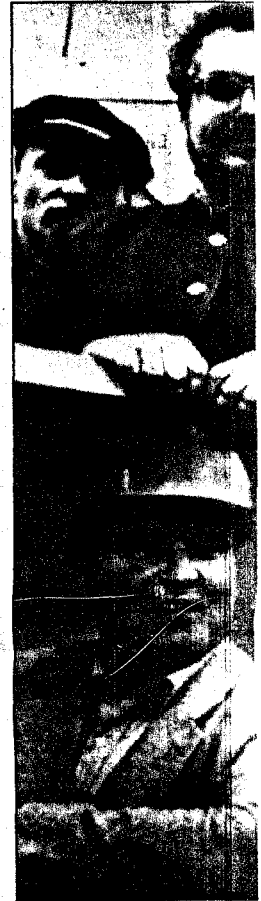
TOPPMØTE: Nazilederne Ch...