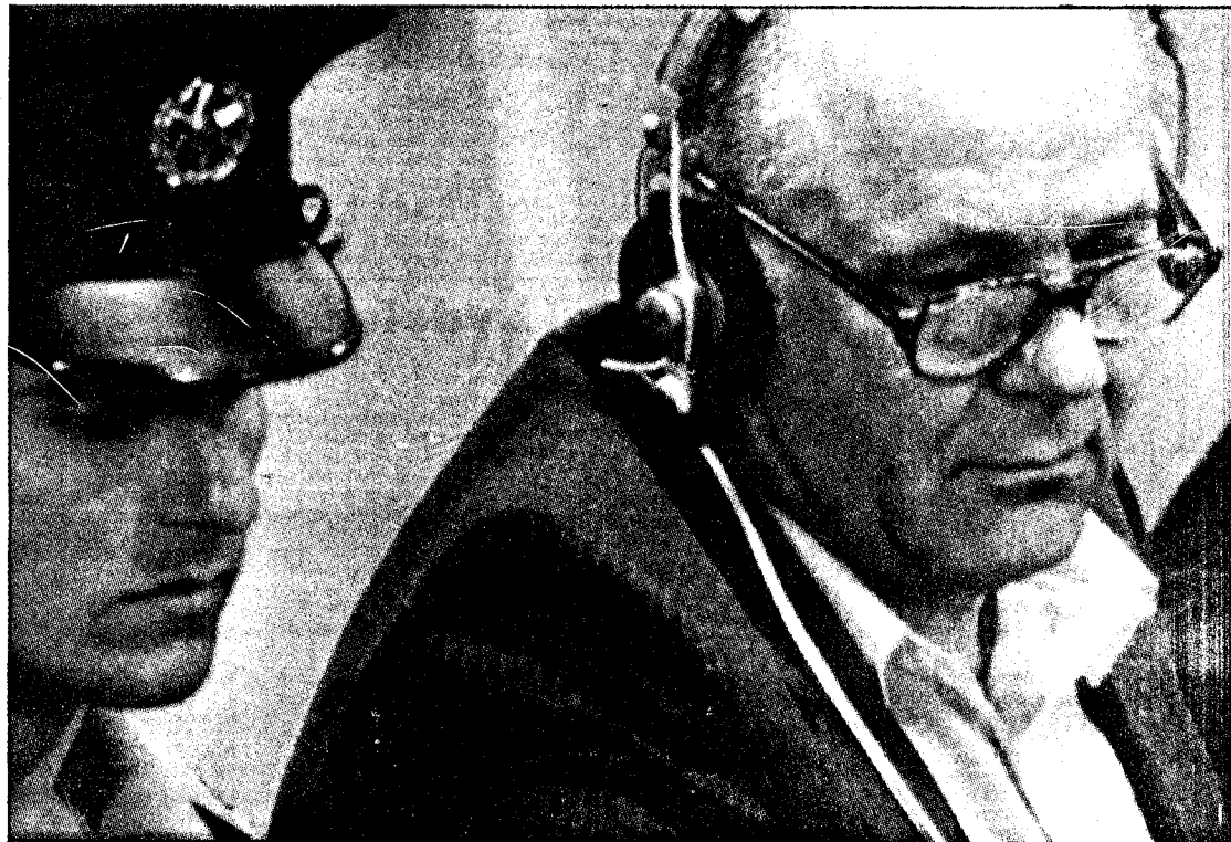
John Demjanjuk ble dømt til døden i Israel for masse mord for tre og et halvt år siden. Var han ikke «Ivan den grusomme» likevel?

Ingen steder i vitneprovne, som ble avgitt mellom 1944 og 1961, blir navnet Demjanjuk