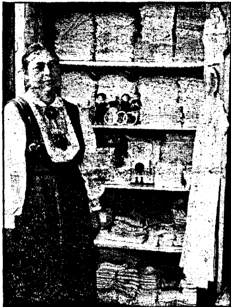
NS-kvinnene åpnet «mødreskole» i 1942. Her fra kurset i spedbarnstell.