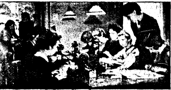
Kvinnene i NS-organisasjonens systue, 1941. Det ble gitt kurser i å sy om ett tøy, etter hvert som knappheten satte inn.