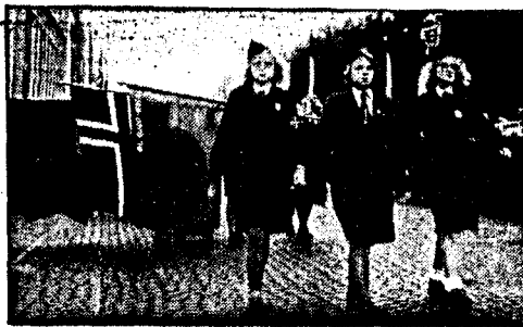
Stor-Oslo Jentehird paraderer for Quisling på Karl Johan, 1942.