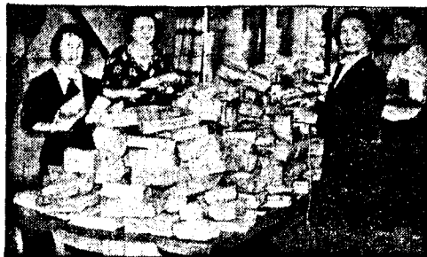
Julepakker til norske frontkjempere, innsamlet i 1942.