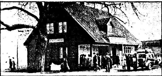
I dette huset på Ankertorget i Oslo åpnet NS Kvinneorganisasjon sin «Husstellstasjon» for å «styrke heimens stilling i Norge».