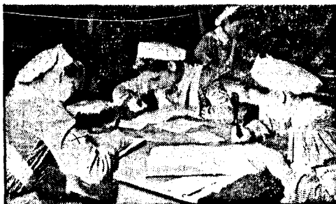
Flere hundre tusen norske kvinner meldte seg som Røde Kors-søstre til Østfronten. Her skriver noen av dem hjem, august 1944.