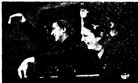
Auf Wiedersehn! Hirdjentene på vei til studieopphold i Tyskland 1941.