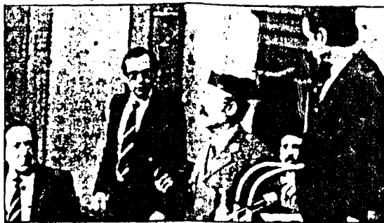
Lederen for kuppemakerne i Spania, oberstløytnant Antonio Tejero Molina — flørt ølvegardistenes tradisjonelle tresutete hatt og tvede armerepol i hånden — idet han overtar makten i parlamentsalen.

En styrke på rundt 200 mann fra den halv-militære sivilgarden under ledelse av oberstløytnant Antonio Tejero Molina holdt imidlertid i morgentimene fremdeles et stort antall regjeringsmedlemmer, partiledere og parlamentarikere som gisler i nasjonalforsamlingens bygning i Madrid. Bygningen var omringet av politit og militæravdelinger som er lojale mot det demokratiske styret, og forhandlinger var i gang for å få okkupertene til å overgi seg frivillig.