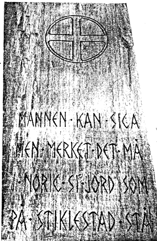
Inskripsjon på den nye norske minnestein på Stiklestad.