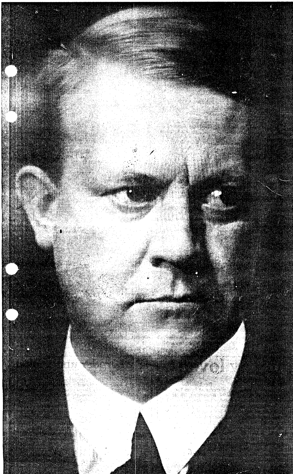
Vidkun Quisling laget inngående planer for et statskupp mens han var forsvarsminister i Bondeparti-regjeringen 1931-1933. Kl. 2 om morgenen skulle militære vakter settes ut på strategiske steder i landet, og en rekke personer skulle arresteres «som siktet for forbrøytelse mot statens selvstendighet og sikkerhet».