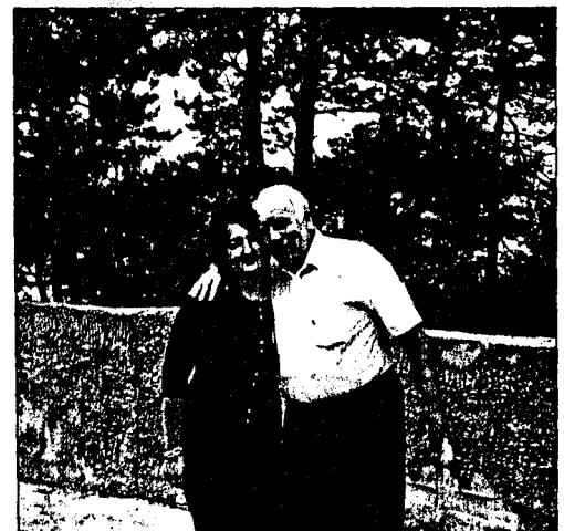
▲ Eksotisk klem fra en skjønnhet i Latvias hovedstad Riga

Nonchalant parkerer vi midt ute på det nesten tomme torget og forlater den for å ta omgivelsene i øyesyn. Med en