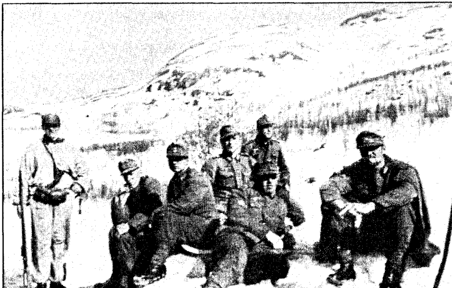
Tyske fanger på Gratangseidet mai 1940.

Om ordregivning skriver Dahl: «Det heter så smukt i alle taktiske direktiver at ordrer fra bataljoner og endog brigader bør gis muntlig til vedkommende sjef. Og det er riktig nok. Men sjef er heller ikke mer enn mennesker. Våre sjefer var til og med 10 år eldre i alle grader – minst – enn det som ansees passende i andre lands feltarmeer. . . . Om jeg derfor ustanselig hadde kalt befalet sammen til konferanser og ordrer over disse