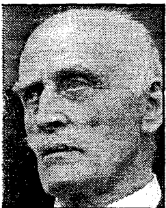
Knut Hamsun - provoserende norske forfattere.