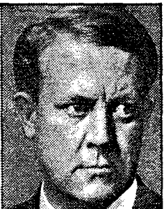
Vidkun Quisling - på ny aktuell i årets bokhøst.