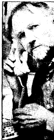
Kjell Fjertoft: - Man kan ikke skille forfatteren Knut Hamsun fra privatpersonen og landssvikeren.