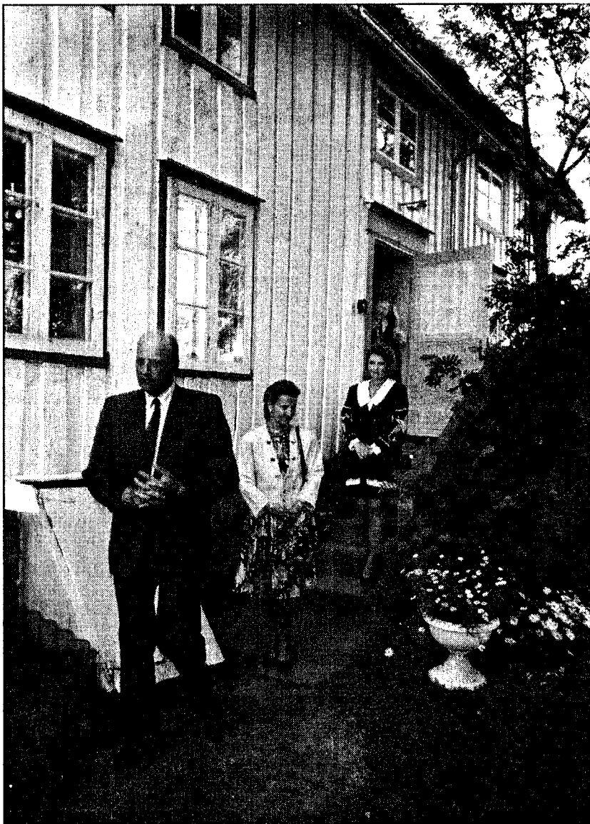
De kongelige forlater Hamsuns barndomshjem, etter et forsonende møte.

Prinsessen kom med fly til Evenes seint søndag kveld. Hun skal være med kongeskippet helt til avslutningen i Brønnøysund i morgen.