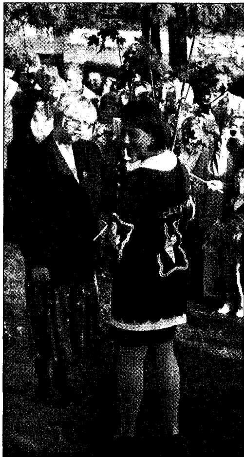
Mor og datter hadde det svært så muntert under besøket ved Det Nasjonale Hamsun-senter på Hamarøy. Prinsesse Märtha Louise plantet et tre i senterets hage.