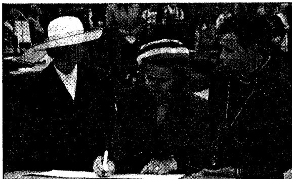
Prinsesse Märtha og dronning Sonja tok seg tid til å signere grunnsteinen til et samisk kultursenter.