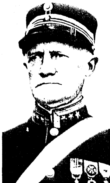
Oberst Birger Christian Eriksen kommandant på Oscarsborg 9. april 1940.