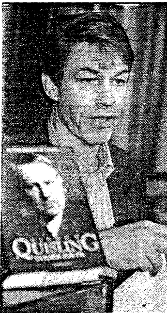
UHELDIG FEIL: Hans Fredrik Dahl er lei seg for at feil person er omtalt som «Quislings trofaste» i sin biografi om Vidkun Quisling.