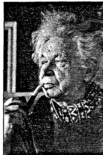
BILLEDHUGGEREN: Professor Wilhelm Rasmussen ble NS-regimets «skulptør» under krigen. Han gjorde søylen ferdig på det nærmeste. «Så får andre trette om hvor den skal reises,» sa han i 1964.

Av to grunner: Den ene er at man fant at monumentet – 45 år etter at krigen var slutt – fortsatt var en politisk og kunstnerisk het sak, for varm til at LOOC ville ta i den. Den andre er at det vil koste masse penger å gjøre statuen ferdig og få den på plass på passende sted i byen.