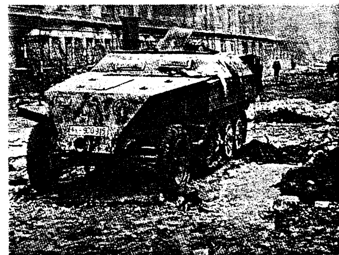
Rechts: Abgeschosener Schützenpanzerwagen der SS-Pz. AA 11 „Nordland“ – Berlin, Chausseestraße – 1945.

Die ausgebrannten Verbände der Division „Nordland“ werden in die Innenstadt Berlins im Raum Anhalter Bahnhof – Cottbuser Platz – Gendarmenmarkt zurückgedrängt. Der letzte Divisionsgefechtsstand befindet sich im U-Bahnhof „Stadtmitte“ (Friedrichstraße). Die Division bezieht endgültig den Verteidigungsabschnitt Unter den Linden – Spittelmarkt – Lindenstraße – Hallesches Tor – Landwehrkanal und verteidigt neben der Kampfgruppe „Mohnke“ (Ersatztruppenteil der LAH) das Regierungsviertel. Stubaf. Saalbachs AA 11 – nur noch Reste – und das Bataillon Fenet