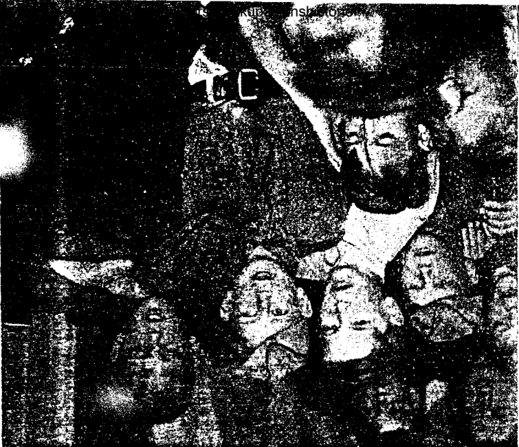
Norges ungdom — Norges framtid.

U. T. tar sikte på å gjøre hver enkelt så dyktig som mulig. Gutten og gjenta skal i U. T. erverve seg kunnskaper som kommer dem til gode i det daglige praktiske liv. De skal selv kunne stelle sine klær og selv lage de mest alminnelige retter mat. U. T. lærer ungdommen å stå på egne bein.