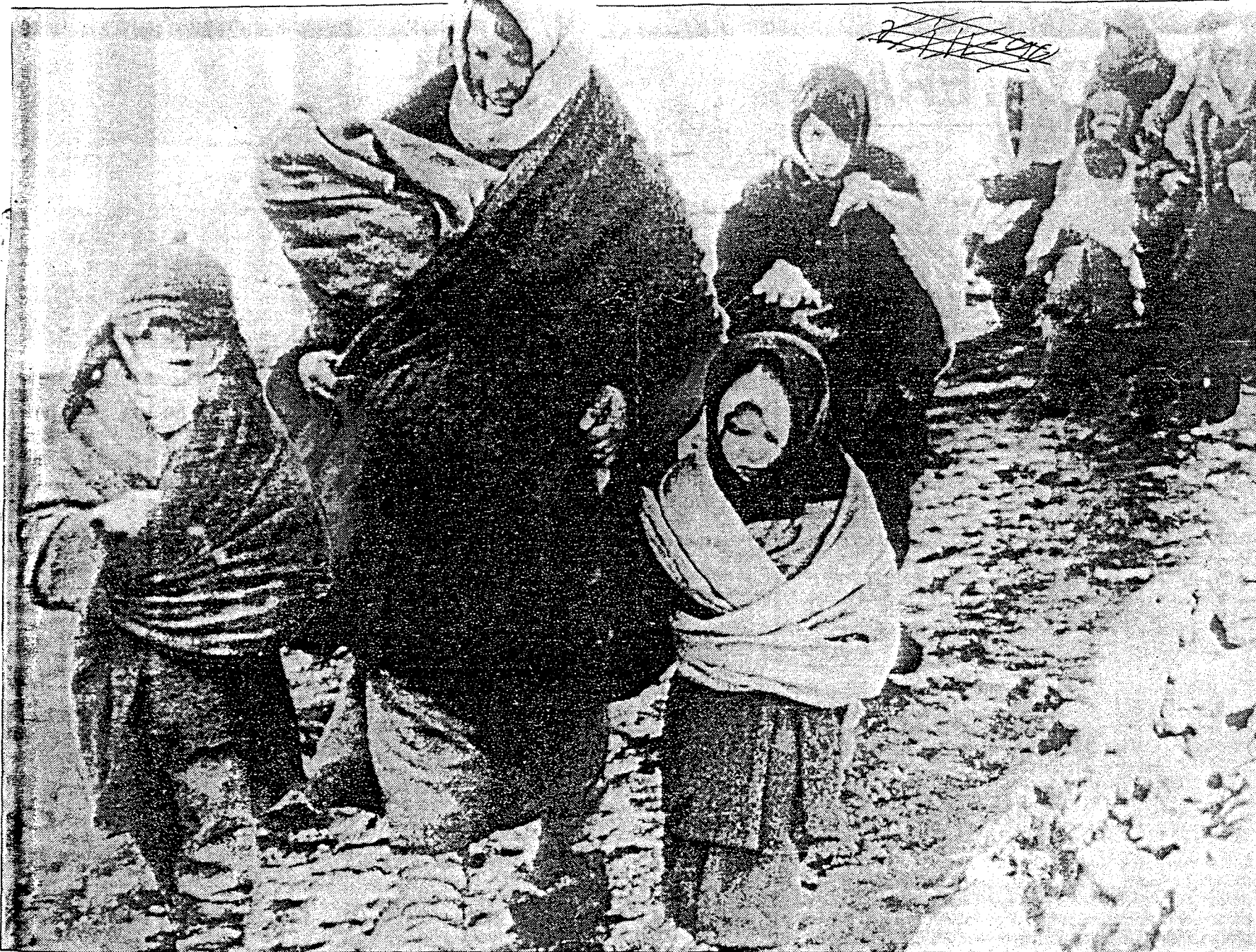
Et skremt folk, Stalins folk. Stadig får vi vite mer om Josef Stalins terror, om tvangsforflytninger og massehenrettelser i 30-årenes Sovjetunionen.