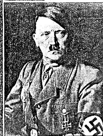
Adolf Hitler henrettet millioner. Men Stalin var før ham.