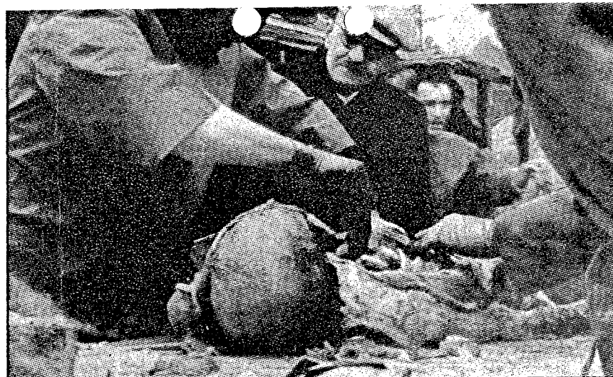
En patolog dissekerer et av likene fra Katyn-skogen der nærmere 4000 polske offiserer ble massakrert. Alle ofrene var skutt gjennom hodet.