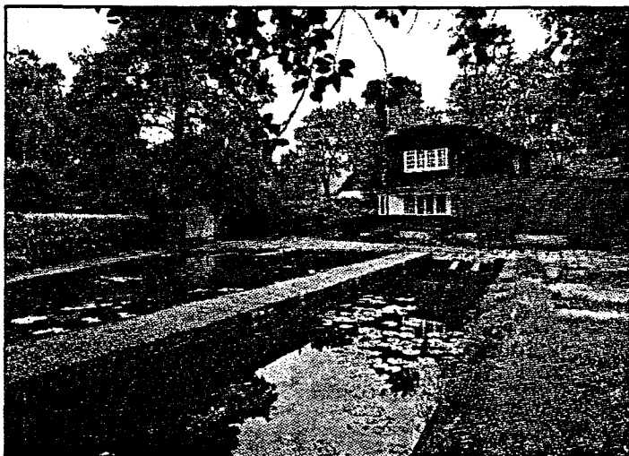
Eiendommen til Norsk Roklubb i Berlin ble tilbakelevert den 15. september. Hus, båthus, brygge og tomt på 1,5 mål menes å være verdt tre millioner kroner.

BERLIN (Dagbladet): Den 15. september var en festdag for medlemmene av «Norsk Roklubb i Berlin». De gamle hardhausene fikk omsider tilbake klubblokale sine. 47 års kamp var kronet med seier.