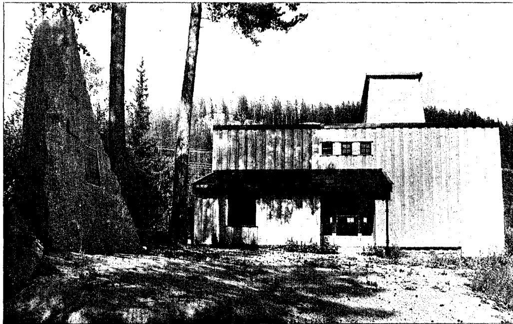
STÅR KLART: Utvendig står bygningen klar. HV har teke den eine halvdel i bruk - no manglar vel eitpar hundre tusen for å få ferdig det skal bli krigsmuseum-delen.

- Vi vonar det skal lukkast å få til eit museum som kan fortelje om det som skjedde i krigens da-