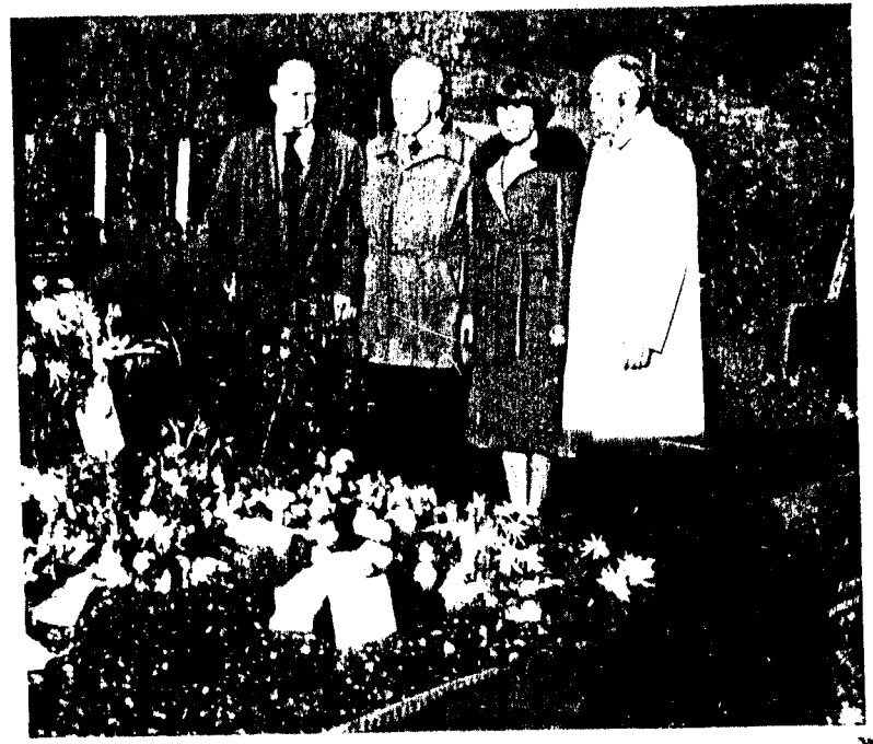
Så er også far død.