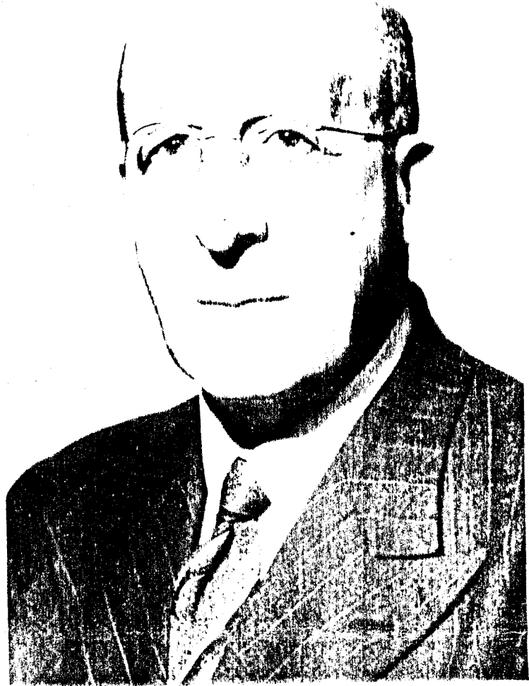
Berg Rolness (A1.5.3.2.1.2.)