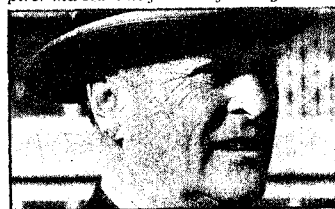
Det var trolig bare kong Olav og faren som visste hva arkivene inneholdt.

Funnet av de private nedtegnelsene til kong Haakon VII er unikt. Liknende historisk arkivmateriale fra Slottet er aldri funnet. Innholdet i de sju enhetene etter kong Haakon er fremdeles en gåte.