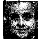
Lars Roar Langslet.

Papirene fra kong Haakons private arkiv ville høyst sannsynlig ha blitt makulert, kastet eller brent hvis ikke tyskerne hadde tatt hånd om dem. Kong Haakon kvittet seg med alt personlig materiale, brev som papirer, fortløpende. Det gjorde også hans sønn, kong Olav V.