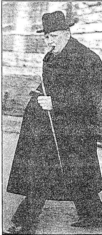
SIR WINSTON CHUR- CHILL: En mann med uvanli- ge dimensjoner — på godt og ondt.

Alt tegnet slik, som ung offi- ser deltok han frivillig på spansk side i krigen mot kubanerne, samtidig som han dypt foraktet Spania og høyt beundret Cuba. Hva slags prinsipper hadde han egentlig? Hvordan så han på medmennesker? Han var skyldig i grove krigsforbrytelser både i Afghanistan og i Afrika hvor hans øverste sjef var Lord Kitchener; et annet råskinn av en krigsfor- bryter og gravskjender. Politisk sett var Churchill en upålitelig