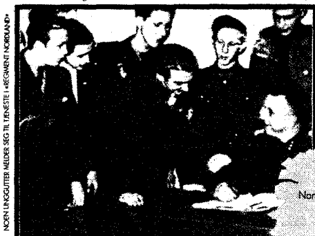
5000 meldte seg til fronttjenesten

– betegnelse for nordmenn som overlevde seg til tysk krigstjeneste under 2. verdenskrig. Felittogene norske frontkjemperer deltok i et tegnet inn.