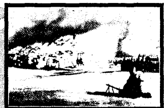
NORSKE FRIVILLIGE I KAMP I SOVJETUNIONEN

Vaktbataljonen: Sykesøstre i tysk krigstjeneste. 350 norske kvinner deltok. 13 drept.