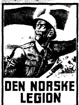
FRAMT AV HARALD DAMSTEN

SS-divisjonen «Wiking»: Del av Tysklands SS. Soldater fra de nordiske land og Nederland. Deltok i Tysklands angrep på Sovjetunionen i juni 1941, i Kaukasus juli 1942. Stalingrad høsten 1942 – vinteren 1943 og i tilbakegangen fra Russland 1943-1945. Kapitulerte i Wien mai 1945. Bare et fåtall av de norske frivillige i «Wiking» overlevde.