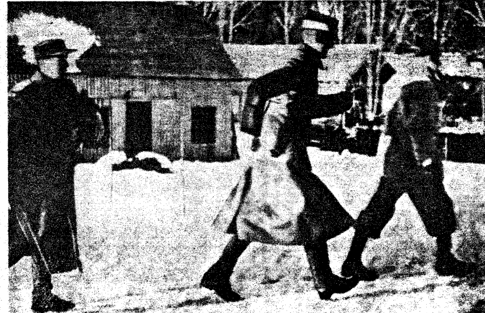
Kongen og Kronprinsessens flukt i skogen (Nybergsgutten da tystene sto dem efter livet.