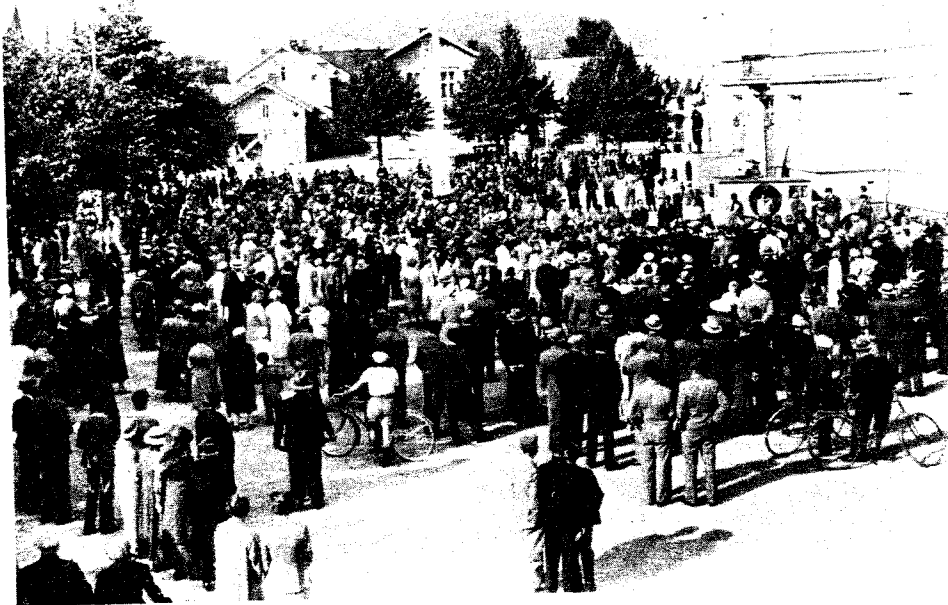
NS-møte på Rådhusplassen i Porsgrunn 1935.