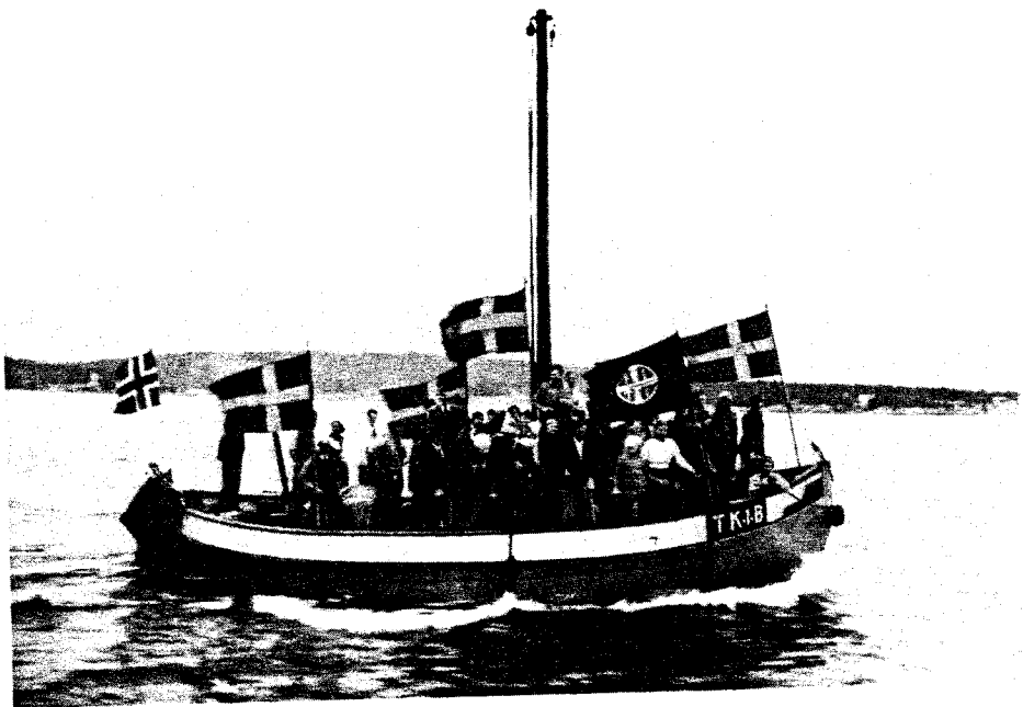
Båttur til Mølen 1936.