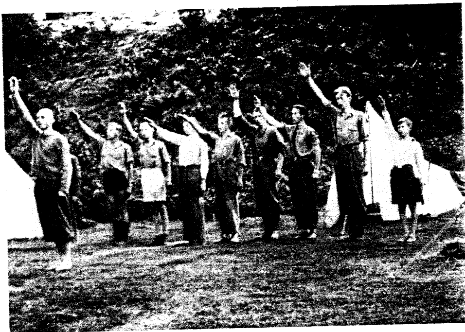
Fra en leir til NS-ungdomslaget 1935.

kort levetid ga resultatet de aktive all grunn til optimisme i partibygginga. Porsgrunnslaget kom raskt opp i et femtitalles medlemmer. Også de nærmest liggende kommuner ble trukket med, spesielt Eidanger. Vinteren 1934 ble et fylkesstyre utpekt. 4 Første fylkesfører var grosserer fra Skien. Han falt høsten 1937 som offiser i Francos fremmedlegion i den spanske borgerkrigen. 5