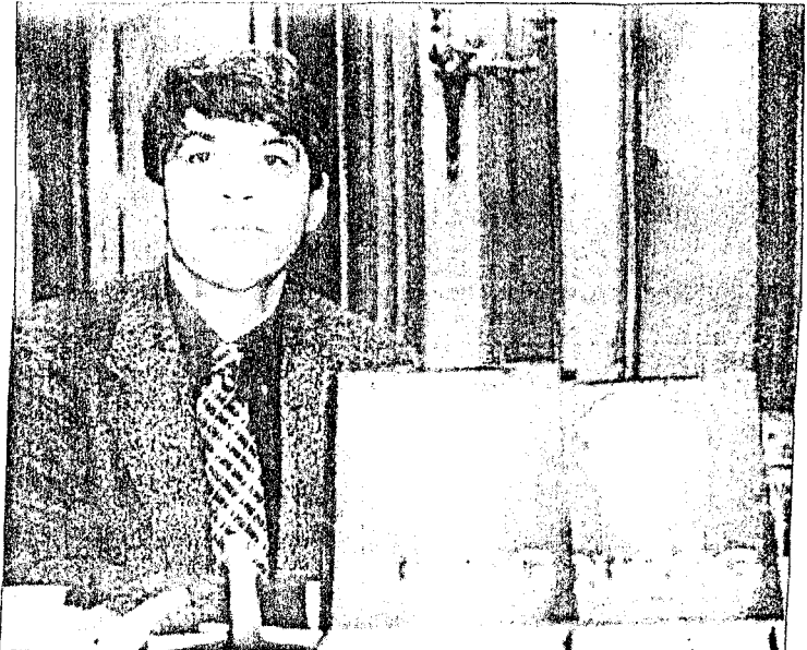
Hans Fredrik Dahl presenterte i år sin andre del av Quisling-biografien

- Hvis man som jeg mener at Quisling bør få samme behandling som en hvilken som helst annen partifører eller statsminis-