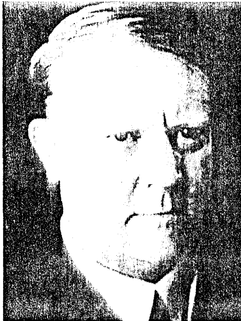
Et hittil ukjent bilde av Quisling under en tur til Tyskland i 1943