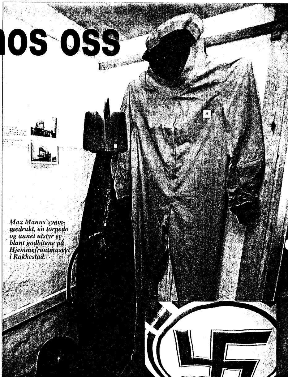
Max Manus' svømmedrakt, en torpedo og annet utstyr er blant godbitene på Hjemmefrontmuseet i Rakkestad.

ber Bruno-kanon der. Den tilhører Eisenbahnbatterie 689, som kom til Rakkestad mot slutten av krigen med to kanoner. Kanonen har samme kaliber som kollegaen på Oscarsborg som senket Blücher om morgenen 9. april.