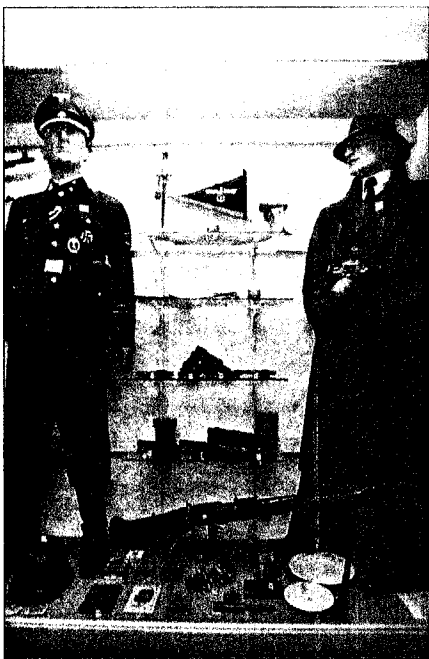
De mest forfattede i den tysk okkupasjonsmakten, SS og Gestapo, har også sin plass i utstillingen.

Også kraftig skyts finnes i montrene. I tillegg til maskingevær og mer hendige håndvåpen står en 28 cm kaliber