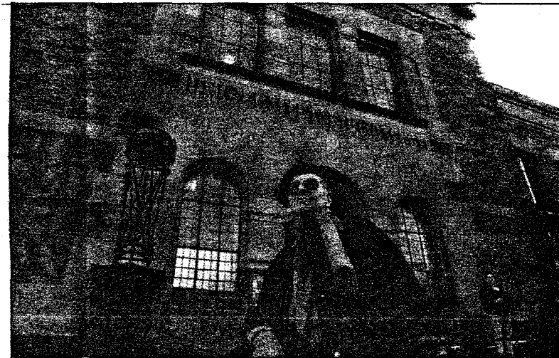
Universitetsbiblioteket ligger bare et stenkast fra hybelen i Frognerveien. Hit søker han ofte til lesesalen...