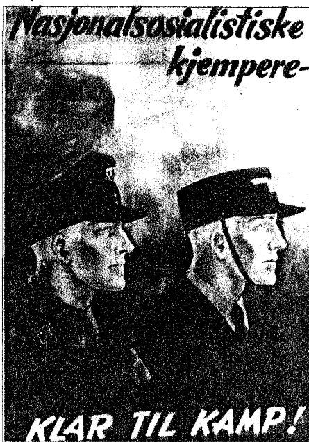
Propagandaplakat for å lokke norske frivillige i tysk tjeneste.