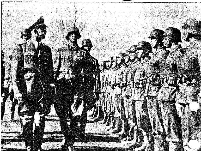
Heinrich Himmler på besøk hos norske frivillige på Østfronten.