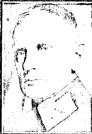
General Ruge Forsvarssjef