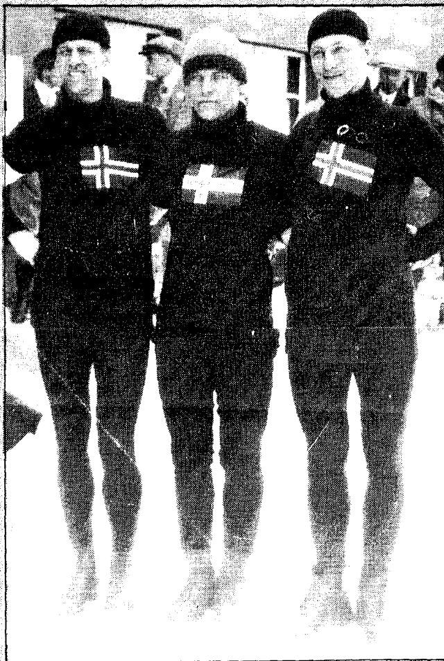
Tre staute karer som jaktet på Oscar Mathisens rekord. Fra venstre: Roald Larsen, Bernt Evensen og Ivar Ballangrud. Dette bildet er fra OL i St. Moritz 1928.