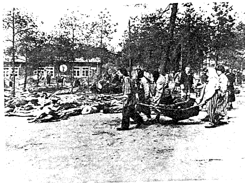
Fra konsentrasjonsleiren Bergen-Belsen.

Fremstillingen er først og fremst preget av noe man kanskje kan kalle «tilgivende forståelse», uten at jeg kan finne historisk dekning for dette. Jeg tviler på om noen av oss alle som er blitt forfulgt og mishandlet pga Quislings forræderi vil være i stand til å gjøre det.