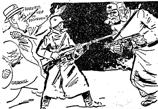
Roosevelt og Churchill helen uns in den Rücken

I Tyskland er det nå en sterk reaksjon mot uten reservasjoner å lenke landets skjebne til USA og England. DEUTSCHE WOCHENZEITUNG gir bl. a. uttrykk for dette i denne tegningen som minner om Vestens forrederi siste gang Tyskland kjempet mot bolsjevismen