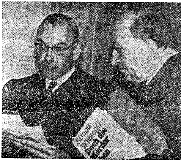
Simon Wiesenthal er én iberdig menneskejeger, men kanskje ikke i dette tilfelle?