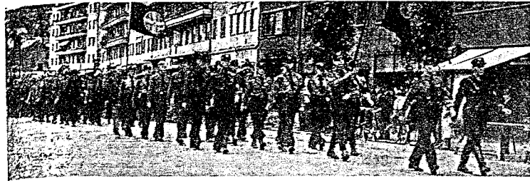
Toget fra Colosseum med en Hirdavdeling i spissen.

kom Sovjet-Samveldet med en skarp protest mot Finnlands initiativ om å slutte en nordisk forsvarsallianse. Slik imot all internasjonal ko-tyrne har Sovjet-Samveldets diplo-