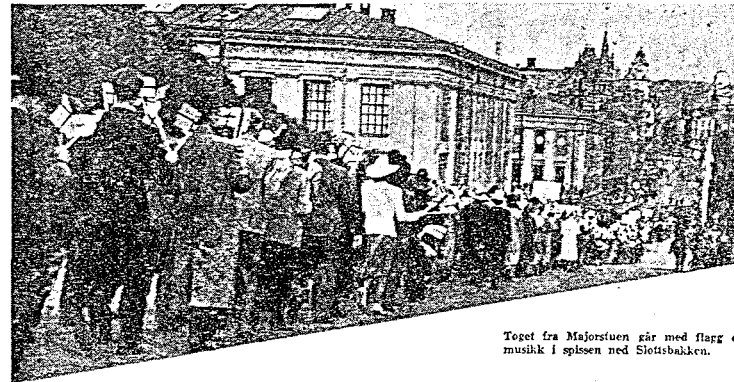
Toget fra Majorstuen går med flagg og musikk i spissen ned Slottsbakken.