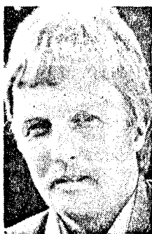
Engbreten vil fortsatt ikke opplyse noe om hvem han har fått NS-materialet fra.